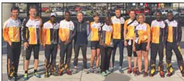
Wöchentlicher Lauftreff in Wien

Für das Laufjahr 2015 haben wir uns erstmals entschlossen, einen regelmäßigen Lauftreff in Wien zu veranstalten. Der Auftakt fand am 10. April im Zuge des Vienna City Marathons sogar mit kenianischer Beteiligung statt. Zahlreiche Run2gether -Mitglieder trafen sich mit den Run2gether -Athleten zum lockeren Einlaufen – ein mehr als würdiger Start des Run2gether -Lauftreffs Wien!