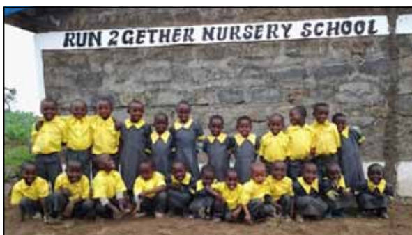
Die Schülerinnen und Schüler der Run2gether Nursery School