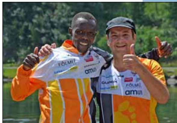
Deutsch-kenianisches Team bei den Laufwochen in Österreich

Ausgebuchte Laufwochen im Sommer 2015 auf der Turrach! Was wir schon 2014 positiv berichten durften, hielt auch 2015 Bestand. Das Interesse, durch gemeinsame Trainingseinheiten voneinander zu lernen, sich auszutauschen über Land, Leute und unterschiedliche Kulturen, brachte unsere bewährte Almstube schon im Jahr zuvor an die Grenzen ihrer Kapazität. Erstmalig haben wir deshalb 2015 auch Zimmer in der benachbarten Gletschermühle angemietet. Auf diese Weise durften wir zwischen Mitte Juni und Anfang September in insgesamt zwölf Laufwochen 207 Gäste willkommen heißen.