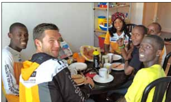
Vor einem Wettkampf zu Gast bei Isolde in Tirol

Die vielen Starts in Europa wären kaum möglich gewesen, wenn wir nicht wieder auf so viele Helfer hätten zählen können, die unsere Läufer beherbergten, sie zu ihren Wettkämpfen begleiteten und dort betreuten. Vielen herzlichen Dank!!!