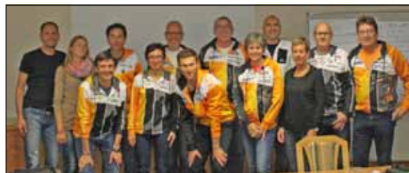
Die Teilnehmer des Strategiewerkshops im November 2015