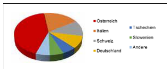
Die Wettkämpfe wurden in mehreren Ländern bestritten