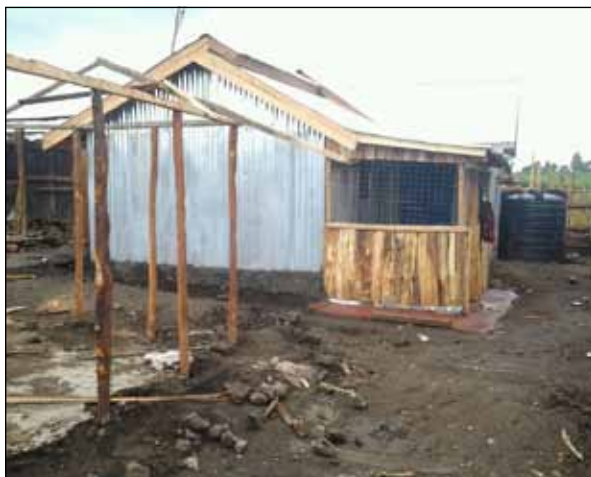
Aufbau des neuen Elternhauses von Gikuni

Sämtliche materiellen Werte der Familie wurden dabei zerstört, die Familie kam vorübergehend bei Nachbarn unter. Neben einer Spendenaktion in Kenia haben wir auch euch um eure Mithilfe zum Neubau eines Hauses gebeten.