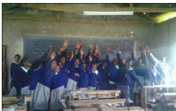
Freude über die neue Klassenzimmerbeleuchtung

Im Vorjahr haben wir auch wieder den „Run2gether Patenpostdienst“ durchgeführt. Wir sorgen dafür, dass die Pateneltern ihren Patenkindern Briefe oder kleine Pakete (maximal A5-Kuvertgröße) schicken können und kümmern uns vor Ort in Kiambogo um die Verteilung. Mehr als 40 Pateneltern haben diesen Postdienst 2015 schon genutzt. Heuer können Sendungen noch bis 31.03.2016 an Thomas KRATKY geschickt werden (Postanschrift: A-2201 Kapellerfeld, Korngasse 2/9 oder per e-Mail an patenschaften@run2gether.com ).