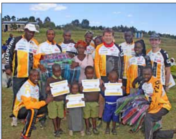
Deckenübergabe an die Familien in Kiambogo