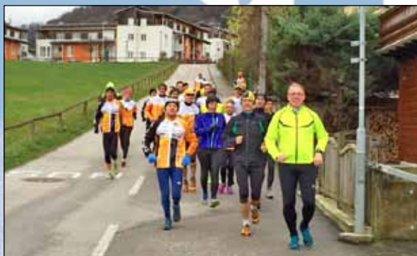
Die Teilnehmer des ersten Run2gether-Laufwochenendes im November 2016

Neben Läufen an beiden Tagen entlang des Ufers des Traunsees, standen vor allem, unserem Leitmotiv „2gether“ entsprechend, gemeinsame Aktivitäten am Programm. So besuchten wir den stimmungsvollen Schlösser Adventmarkt im Landschloss und im Seeschloss Ort, am Abend konnten wir bei einer Mitgliederinformation über unsere diesjährigen Vereinsaktivitäten berichten und Ausblicke auf die kommen-