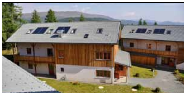
JUFA Nockberge Almerlebnisdorf

Was auf der Hebalm begann, wurde 2010 auf der Turracher Höhe fortgesetzt. Nun verlagern wir die Heimat unserer Höhenlaufwochen erstmals auf die Hochrindl , wo wir ab Sommer 2016 im dortigen JUFA-Hotel zu Gast sein werden. Inmitten der Kärntner Nockberge erwarten dich wunderschöne, neue Laufwege und ein neues Haus. Die bewährte Philosophie unserer Laufwochen behalten wir natürlich bei! Wir wollen im Miteinander (2gether) voneinander lernen und profitieren. Für detaillierte Informationen dürfen wir auf unsere Run2gether -Homepage verweisen: http://run2gether.com/info/hochrindl/