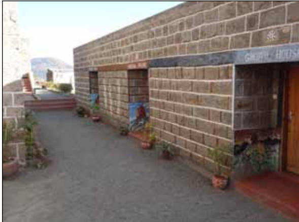
Sieben typisch kenianische Gästezimmer erwarten unsere Gäste