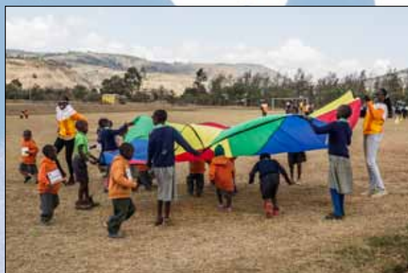
Das Spielefest ist voll im Gang

Tatkräftig unterstützt wurden wir an diesem Tag von allen Camp-Gästen und natürlich auch von unseren Athleten. Die Aufgaben reichten dabei vom Streichen von 850 Marmeladenbroten bis hin zur Betreuung der Spielestationen. Am Spielefest nahmen insgesamt 350 Kinder und Erwachsene teil. Die