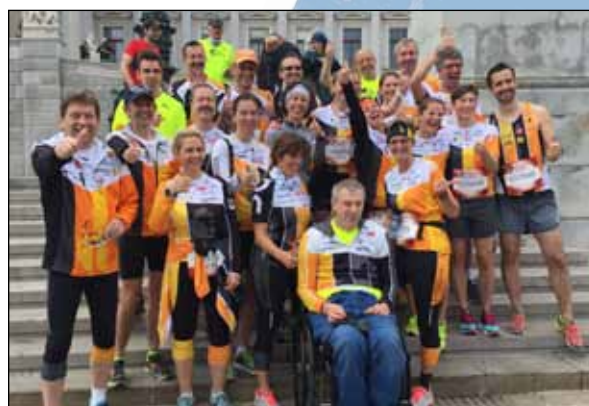
33 run2gether Läufer starteten beim Wings for Life World Run

Schon zum zweiten Mal formierte sich eine stattliche Gruppe von run2gether Mitgliedern und Freunden, um beim Wings for Life World Run in weltweit 25 verschiedenen Austragungsländern teilzunehmen. Die größte run2gether Gruppe traf sich in Wien und feierte dort gemeinsam mit insgesamt 13.000 Teilnehmern ein tolles Charityfest. Das Besondere an diesem Bewerb ist die Verfolgung der Läufer durch das sogenannte Catcher Car. Sobald sich das Auto auf Höhe des Läufers befindet, endet das Rennen für diesen. Für run2gether starteten 33 Läufer , zusammen absolvierten wir 448 Laufkilometer zu Gunsten der Rückenmarksforschung!