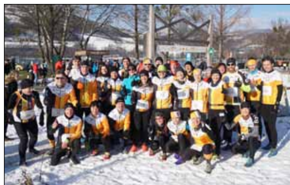
run2gether Mitglieder unterstützen den Stubenberger Adventlauf