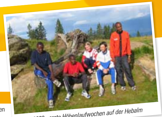
2008 - erste Höhenlaufwochen auf der Hebalm