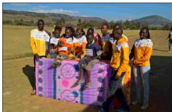
Die Matratzen werden an die Familien übergeben

Im Anschluss an eine Jause für alle Teilnehmer verteilten wir die Matratzen und Schuhe an unsere Patenkinder. Jede unserer Patenfamilien bekam drei bis vier Matratzen überreicht, was wir natürlich auch auf unzähligen Fotos für unsere Paten dokumentierten. Als Draufgabe gab es für jede Familie noch je 2 kg Lebensmittel.