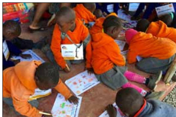
Die Patenkinder zeichnen mit großem Eifer für ihre Paten

Kinder waren von den Spielen, vor allem vom Sackhüpfen und Zielwerfen begeistert. Bei einer weiteren Station malten die Kinder Zeichnungen für ihre Paten in Europa.