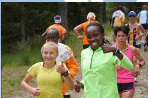
Auf der Hochrindl hat jeder Gast seinen persönlichen Pacemaker

Nach der erfolgreichen Premiere 2016 waren wir glücklich, unsere Laufwochen auch 2017 mit unserem Partner, dem JUFA-Hotel auf der Hochrindl abhalten zu können. Mit dem Anspruch, sich jedes Jahr noch ein Stückchen weiterzuentwickeln, wurde auch dieses Mal wieder am Programm für die Sommerwochen gefeilt. Somit gab es zu bewährten Programmpunkten aus den letzten Jahren für unsere Gäste neue Optionen. Einerseits konnte man sich von unserer Phy-