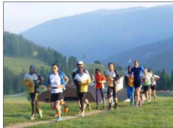
Stimmungsvoller Morning Run in den Südtiroler Bergen

Ebenso erfreulich entwickelte sich die Juni-Laufwoche im Hotel Cendevaves in St. Christina in Südtirol in nicht minder schöner Atmosphäre am Fuße des Langkofels, die sich inzwischen fest in unserem Sommerplan integriert hat. Wir sind deshalb sehr glücklich, auch 2018 wieder eine Woche bei Familie Stuffer zu Gast sein zu dürfen.