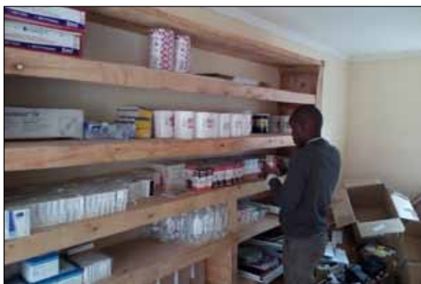
Ausreichend Platz für ärztliche Untersuchungsmaterialien

Wir haben uns daher entschieden, mit unseren Paten- und Sponsorengeldern die Einrichtung für die Arztstation zu finanzieren. Es wurden also Regale gebaut, ein absperrbarer Raum eingerichtet, Sessel für den Warteraum angeschafft, elektrischer Strom eingeleitet und schlussendlich ein Kühlschrank für die Aufbewahrung verderblicher Medikamente gekauft.