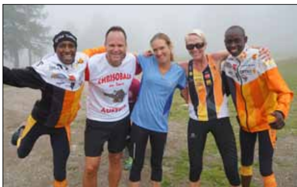
run2gether verbindet Leistungs- und Hobbysportler aus Europa und Afrika

Jedes einzelne Mitglied , sei es ein förderndes oder Vollmitglied, trägt mit seinem Beitrag wesentlich zum Gelingen unserer Säulen bei. Insofern sind auch Nichtläufer, die uns mit ihrer Mitgliedschaft unterstützen wollen, jederzeit aufs Herzlichste willkommen!