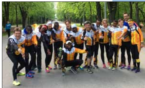
Einige kenianische Athleten besuchen uns beim Lauftreff

Herzlichen Dank an dieser Stelle an alle für die rege und regelmäßige Teilnahme. In den Sommermonaten, wenn auch kenianische run2gether Athleten gemeinsam mit uns trainierten, war der Zulauf zum Lauftreff besonders groß. Mit Stolz verfolgten wir, wie wir mit unseren run2gether -Dressen viele Blicke anderer Läufer auf uns zogen!