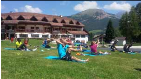
Mobigym unter freiem Himmel im schönen Grödnertal