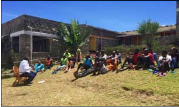
Volle Aufmerksamkeit, wenn der Coach spricht