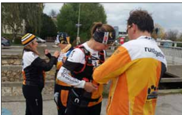
Staffelübergabe beim Wien Rundumadum Lauf

Diese „Tradition“ wollen wir auch im kommenden Jahr fortsetzen und ein erlebnisreiches Miteinander auch im Amateurtteam anbieten. Über diese speziellen Events werden wir dich zusätzlich informieren. Einige davon haben wir in unserem Laufkalender bereits für dich markiert.