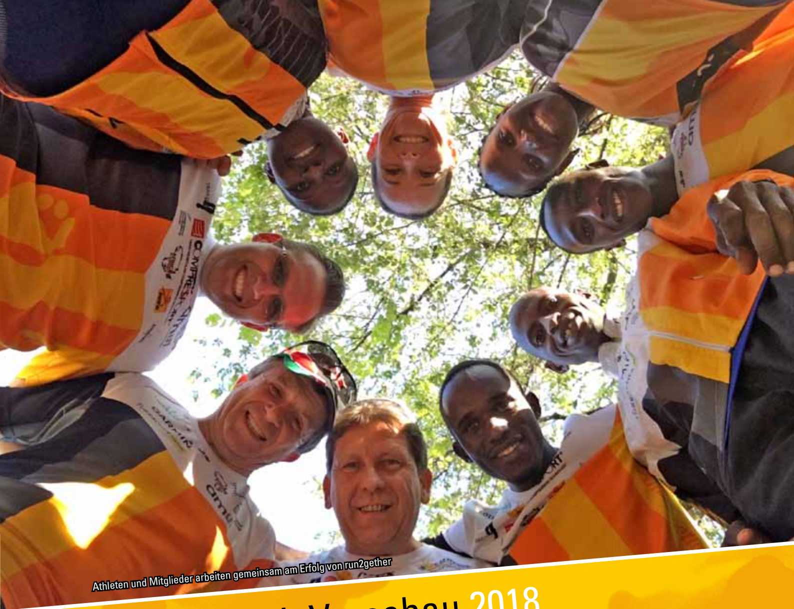
Athleten und Mitglieder arbeiten gemeinsam am Erfolg von run2gether