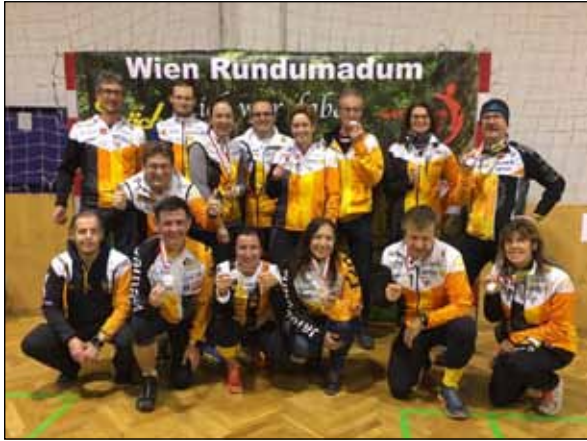
17 run2gether Hobbyläufer liefen gemeinsam rund um Wien