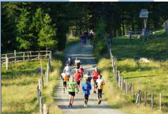
Unterwegs auf einer der malerischen Laufstrecken auf der Hochrindl

Du kannst deinen Laufurlaub bequem über unsere Homepage unter http://run2gether.com/laufwochen/ oder per E-Mail bei tim@run2gether.com buchen!