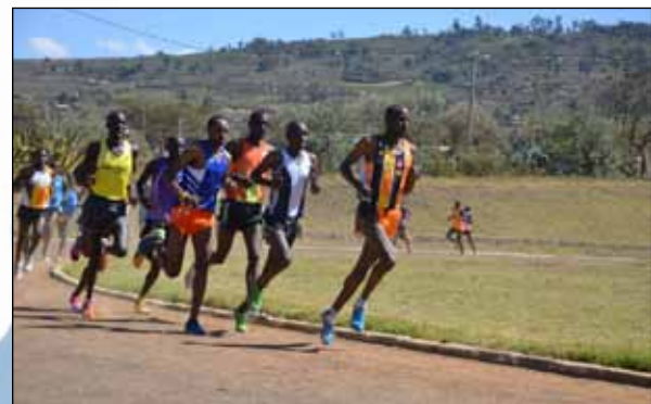
Trial auf der run2gether Laufbahn in Kiambogo

Ein wichtiges Instrument zur Talentsuche sind die von run2gether regelmäßig veranstalteten Trials in Kiambogo . So konnten wir mit fast monatlichen Einladungen zu Bewerben auf unserer Laufbahn und im Gelände junge Läufer aus verschiedenen Regionen in Kenia ansprechen. Die in der