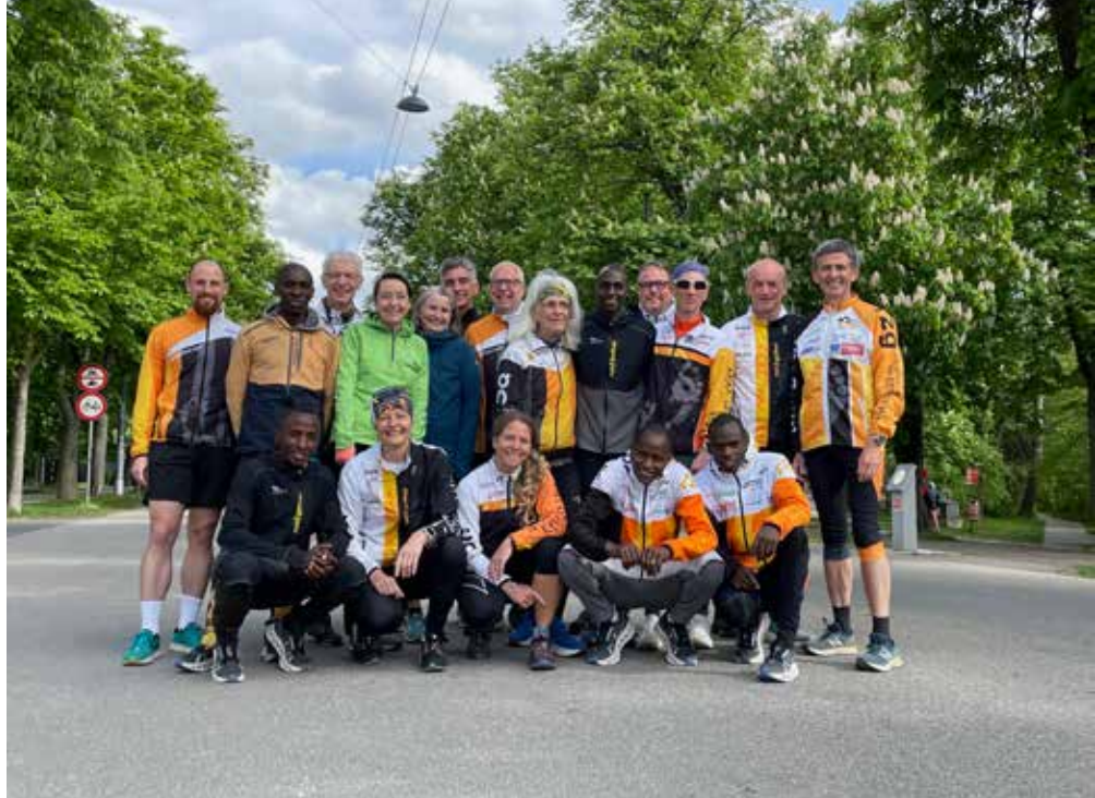
Lauftreff mit unseren Athleten vor dem Vienna City Marathon