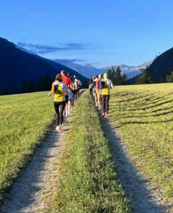
Gemeinsames Lauftraining ist das Kernelement der Laufwochen