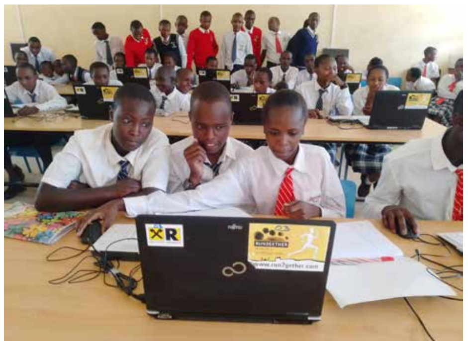
Die Schüler der Secondary School freuen sich über ihren renovierten Computerraum

Die Weiterführung der Aktion „Fruits for Children“, die allen 2.400 SchülerInnen an den fünf Partnerschulen in Kiambogo regelmäßig frisches Obst ermöglicht, bringt große Freude bei den Kindern. Dank der Spenden aus Europa konnten wir diese wertvolle Ergänzung zur einseitigen Schulkost fortlaufend realisieren und so einen wichtigen Beitrag zur gesunden Ernährung der Kinder leisten.