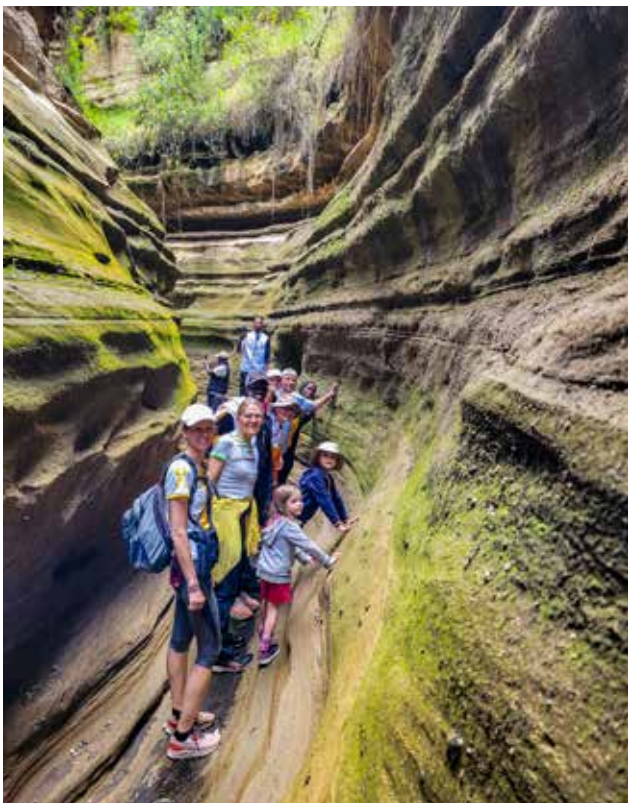
Wanderungen sind Teil der Run.Yoga.Safari

Run.Yoga.Safari - neugierig geworden? Dann schreib uns!