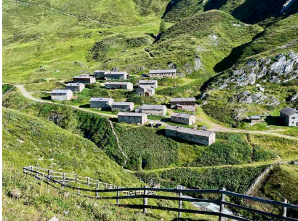
Die idyllisch gelagerten Jagdhause-Almen im Defereggental, auch „Klein Tibet“ genannt

Ein Angebot, das auch unsere Gäste während ihres Aufenthalts in Kals gerne in Anspruch nehmen.