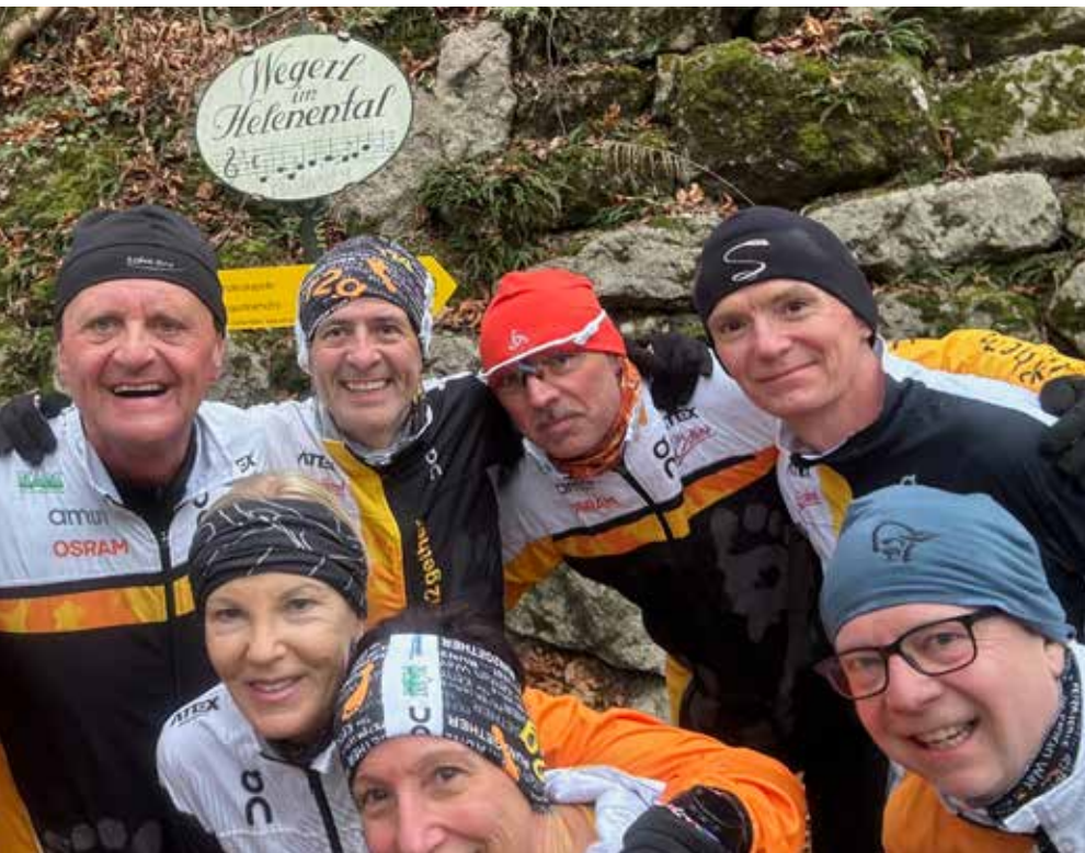
Morning Fun Run im Helental