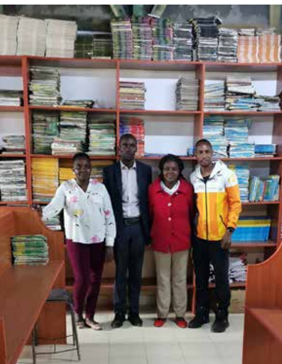
Die neue Schulbibliothek der Secondary School wurde feierlich eröffnet

Die Erfolge des Jahres 2024 sind das Ergebnis eines engen Zusammenhalts und großen Engagements unserer Unterstützer. Besonders die Patenschaften mit fast 400 geförderten Kindern und die run2gether Nachwuchs Academy zeigen, was Sport als verbindendes Element von Mensch und Kultur bewirken kann.