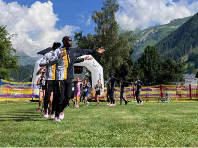
Auch in Kals kann man von unseren Profiläufern profitieren

2024 besuchte unter anderem eine der besten Trailläuferinnen der Welt, Sara Alonso unser Camp. Auch das Österreichische Orientierungslauf Nationalteam verbrachte erstmals vier Trainingswochen im Camp. Dennoch ist die Buchungslage ab April bis Ende des Jahres unbefriedigend, so dass wir immer wieder neue Wege suchen, um dies zu ändern. Wir wollen die Trainingsbedingungen für Trailläufer noch attraktiver und den Standort unseres Camps auch für Nichtläufer interessanter gestalten. So viele Aktivitäten und Ausflugsmöglichkeiten bieten sich von Kiambogo aus an.