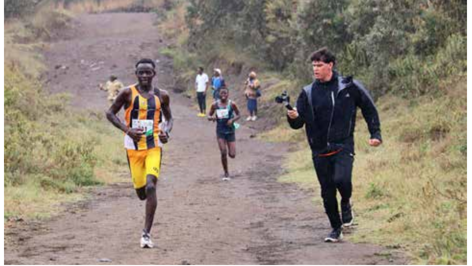
Starke Leistungen unseres Teams bei der 1. Mt. Longonot Trail Challenge!