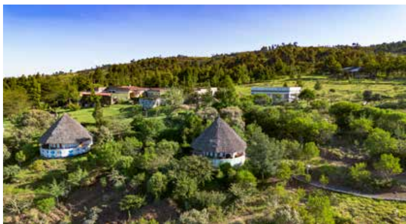
Eine stattliche Investitionssumme ist über die Jahre ins Camp und in die Gemeinde Kiambogo geflossen