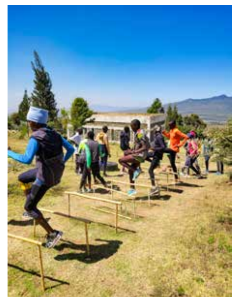
Unser Trainingscamp findet sich in der Neuauflage „Reise Know How Kenia“ wieder

Vor wenigen Wochen knüpften wir Kontakt zu den Autoren des Reiseführers „Reise Know-How Kenia“, die selbst auch in Kenia eine kleine Bungalowanlage am Strand südlich von Mombasa, abseits von touristischen Strandbereichen betreiben. In der neuen Ausgabe des Handbuchs (geplanter Erscheinungszeitraum Frühsommer 2025), das sich auf „individuelles Entdecken“ Kenias spezialisiert, wird das run2gether Camp in Kiambogo vorgestellt. Wir hoffen, dass wir dadurch ein neues Publikum für unser Camp anziehen und gewinnen können.