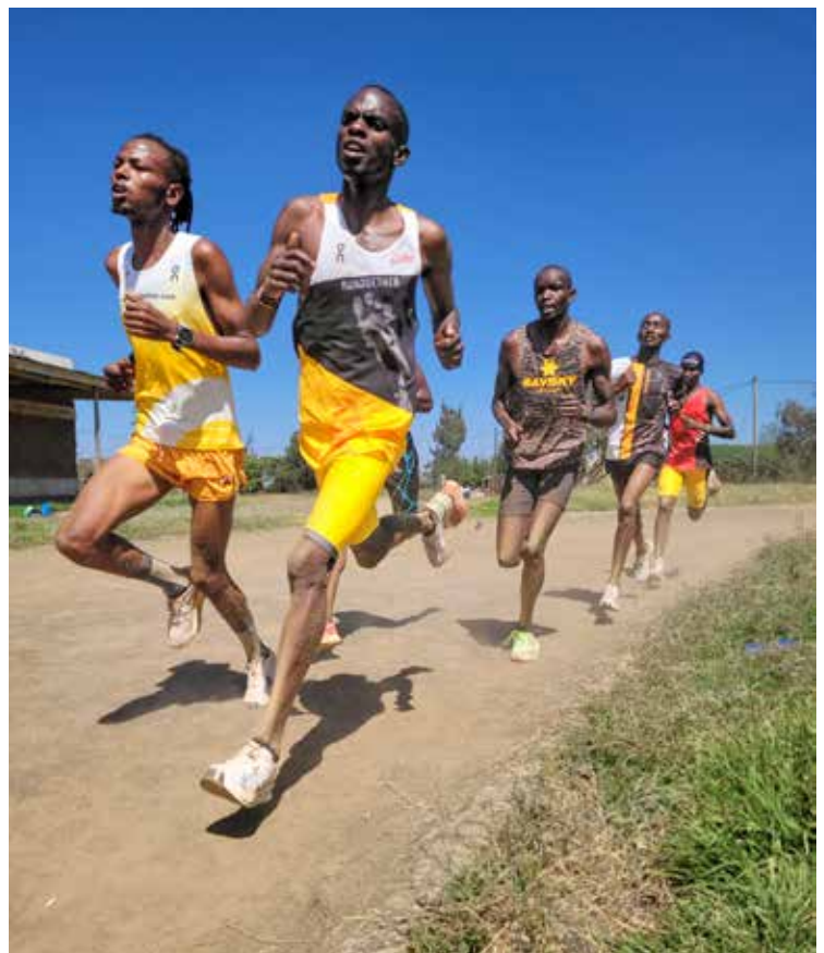
Ganzjährig kann man mit unseren Athleten im Camp gemeinsam trainieren und leben

In Kenia ist unser Camp und unser Verein längst ein Begriff. Im kenianischen Verband Athletics Kenia (AK) ist run2gether in der Berg- und Traillauf-Sektion beratend verantwortlich und die internationalen Erfolge unserer Athleten in allen Laufbereichen finden in der Athletenszene und in den nationalen Medien immer wieder große Aufmerksamkeit. Diesen Aufschwung wollen wir auch für das Camp nützen, das von April bis Dezember bisher leider nur wenige Gäste anzieht.