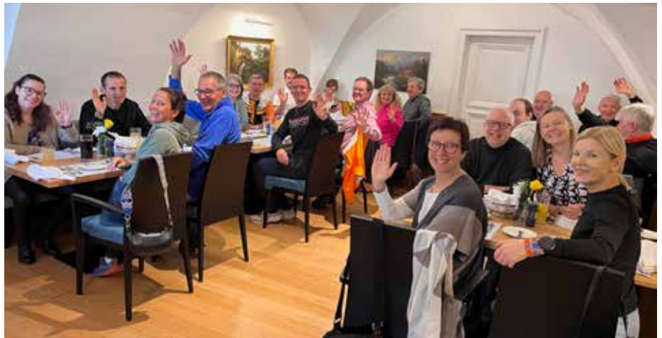
Die Teilnehmer des 9. Mitgliederwochenendes

Im Anschluss spazierten wir am frühen Nachmittag nach Baden bei Wien und besuchten den Adventmarkt im Kurpark. Nach dem Abendessen im Hotel konnten die Mitglieder noch unsere Vereinsbekleidung aus unserem Sortiment erwerben. Beim Abendessen im Hotel ließen wir den abwechslungsreichen Tag ausklingen.