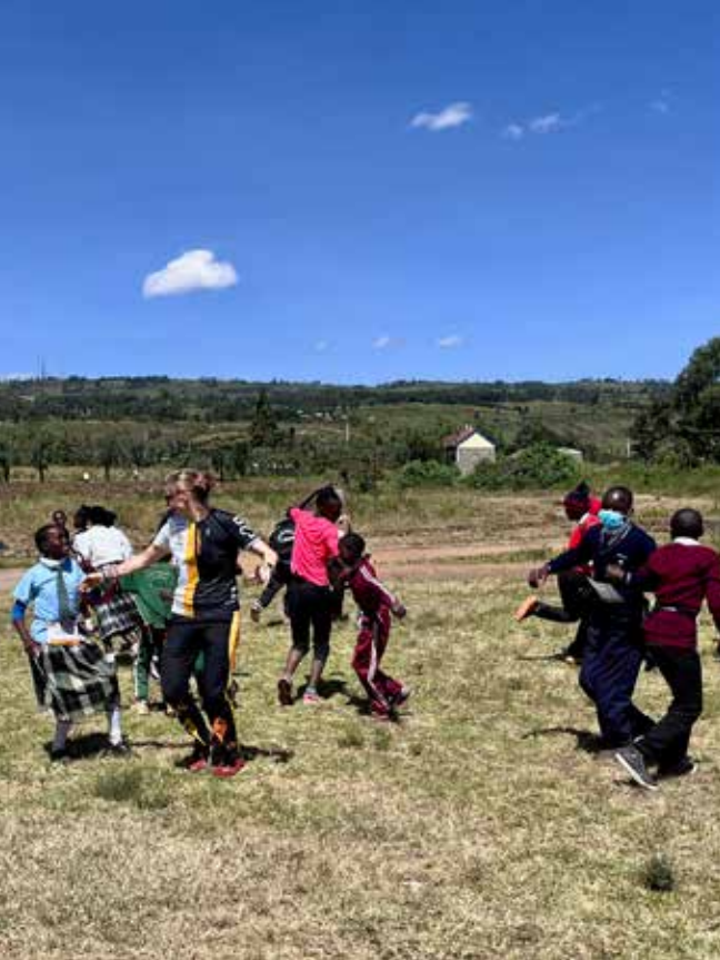
Kinderfest - Gemeinschaft erleben, beginnt bei den Jüngsten