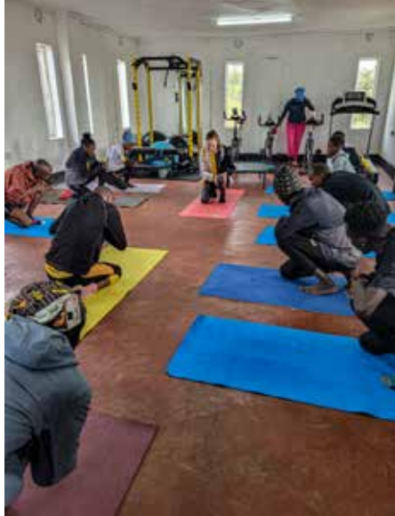
Unser Gym wird viel genutzt